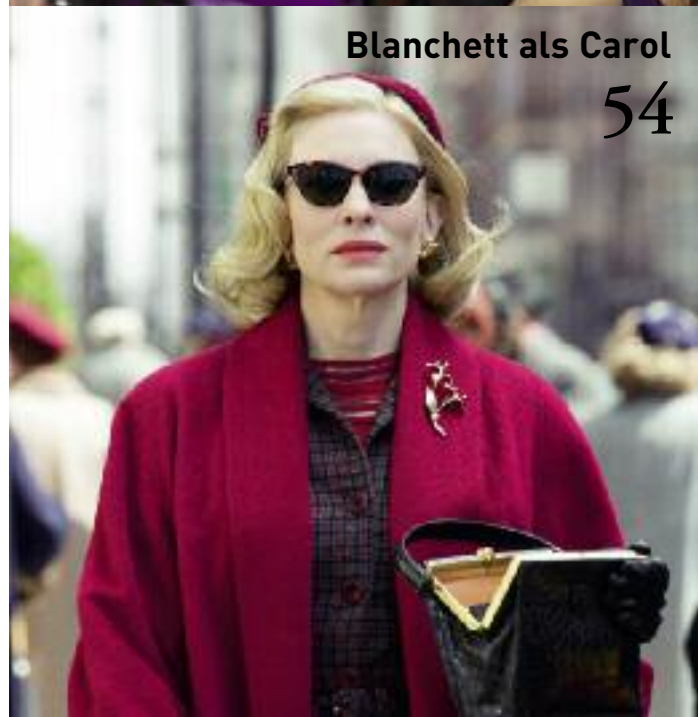
Blanchett als Carol