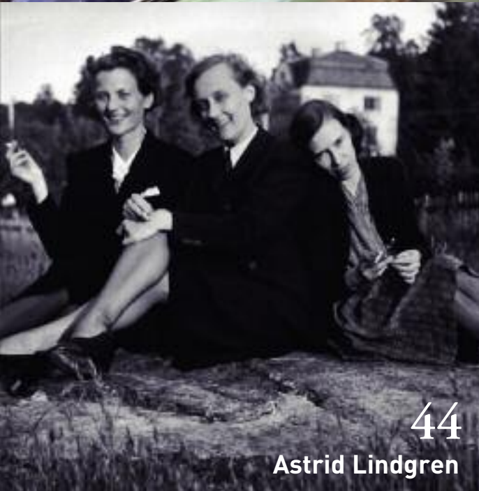
44 Astrid Lindgren