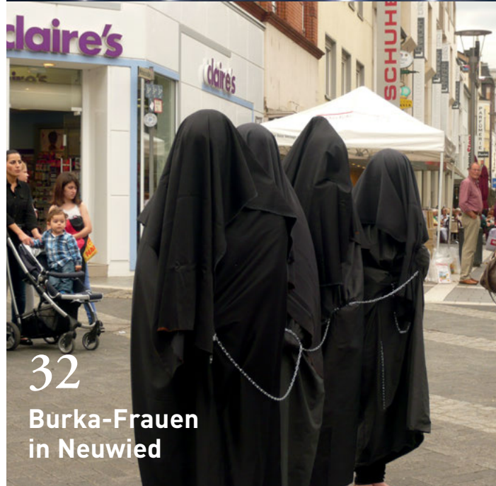
Burka-Frauen in Neuwied