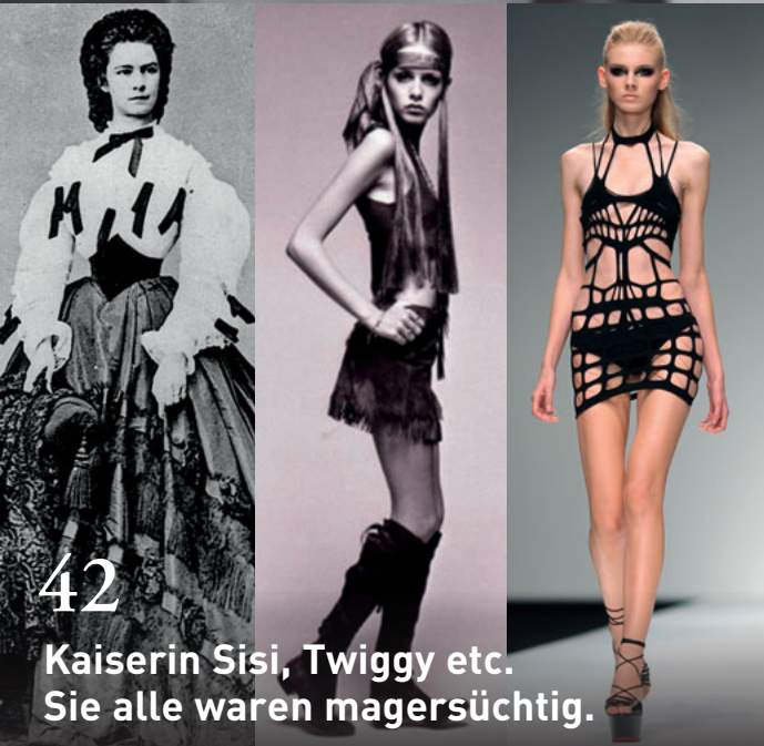
42 Kaiserin Sisi, Twiggy etc. Sie alle waren magersüchtig.