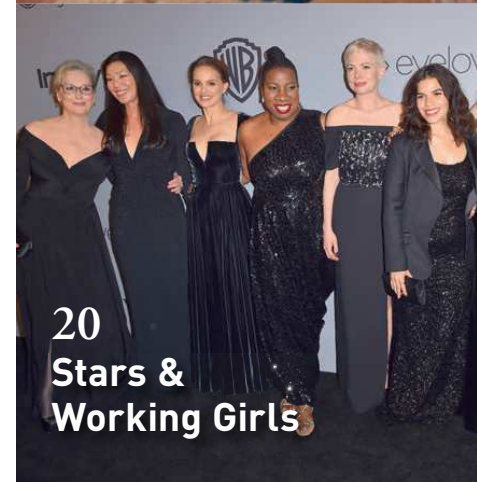
20 Stars & Working Girls