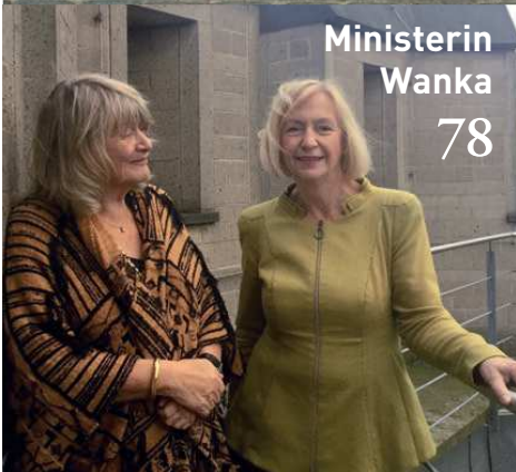
Ministerin Wanka 78