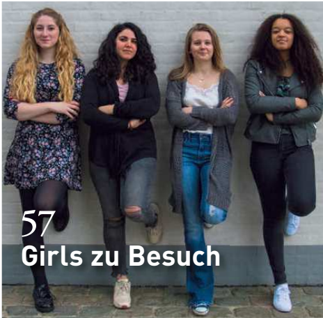
57 Girls zu Besuch