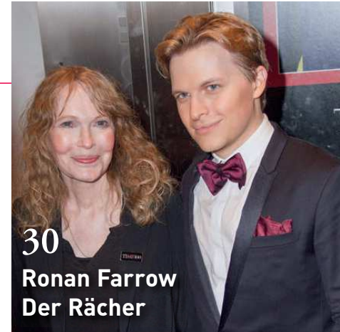
30 Ronan Farrow Der Rächer

Schwarzer: „Meine algerische Familie“ 22€