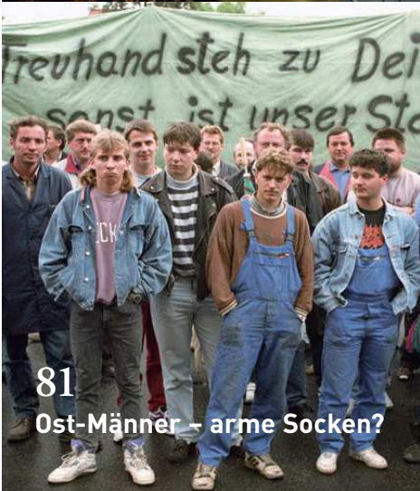
81 Ost-Männer – arme Socken?

6 Schwarzer über Sexualität & Gewalt Es geht nicht um Sex, es geht um Lust an Gewalt.