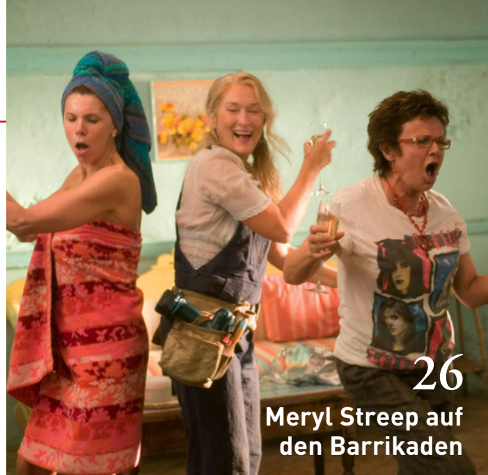
26 Meryl Streep auf den Barrikaden