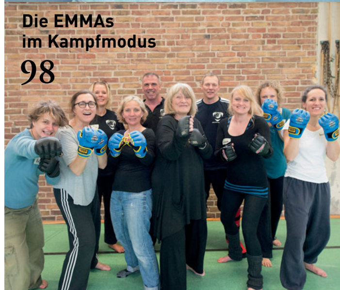
Die EMMAs im Kampfmodus