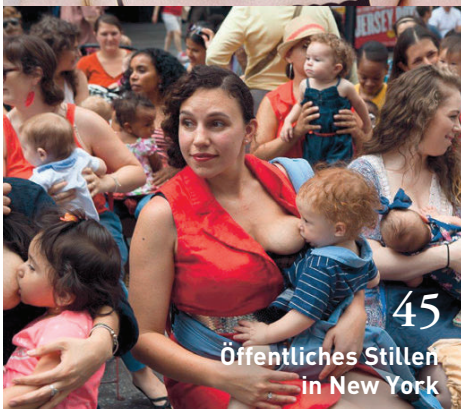
45 Öffentliches Stillen in New York