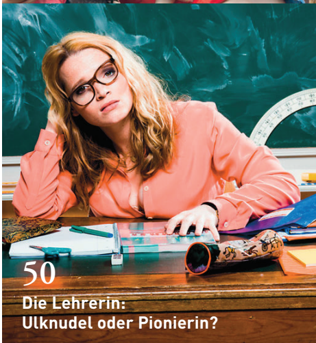
50 Die Lehrerin: Ulknudel oder Pionierin?