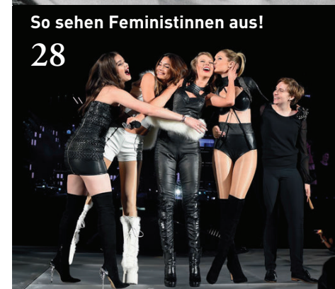
So sehen Feministinnen aus! 28