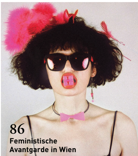
86 Feministische Avantgarde in Wien