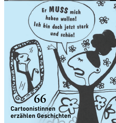
66 Cartoonistinnen erzählen Geschichten