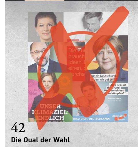
42 Die Qual der Wahl