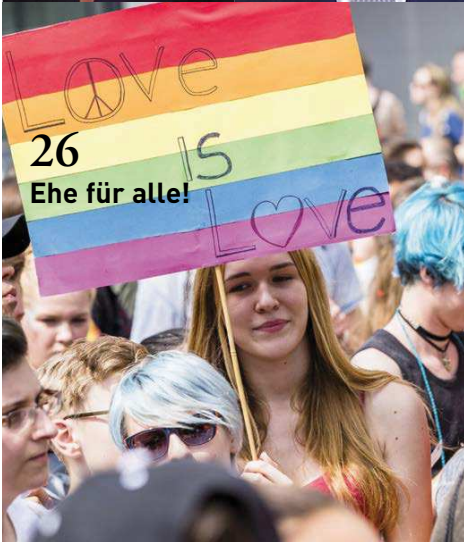
26 Ehe für alle!